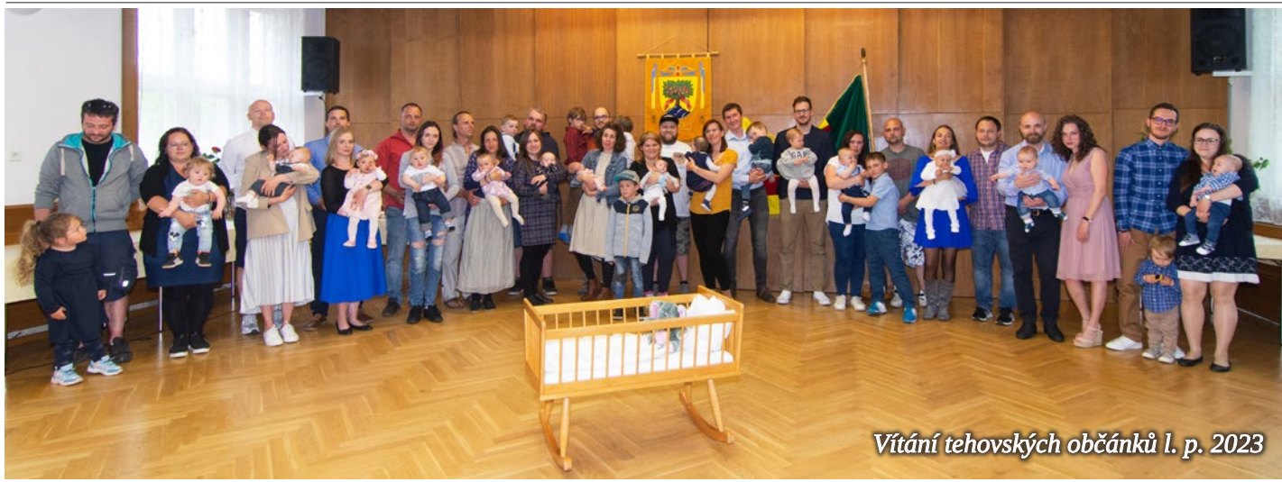
Vítání tehovských občánků I. p. 2023