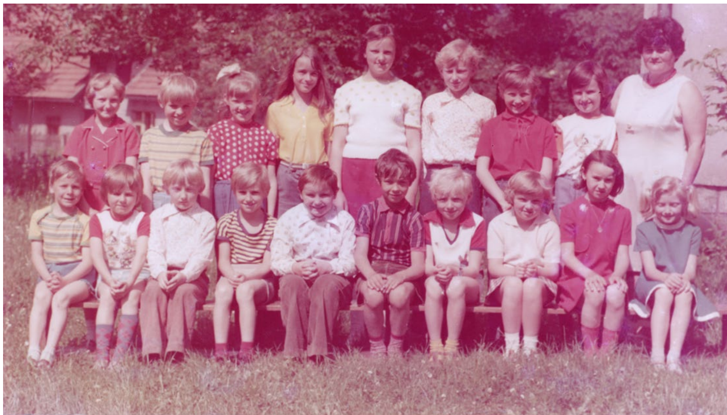
Šk. rok 1976/1977