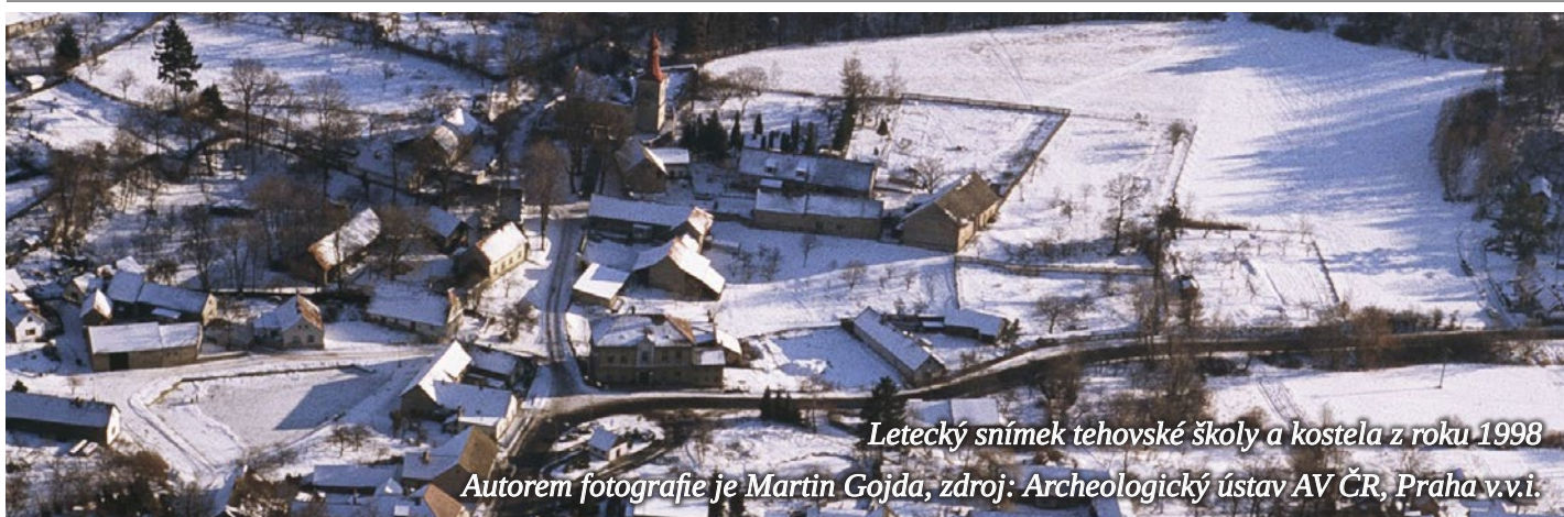
Letecký snímek tehovské školy a kostela z roku 1998