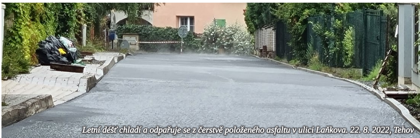
Letní déšť chladí a odpařuje se z čerstvě položeného asfaltu v ulici Laňkova. 22. 8. 2022, Tehov