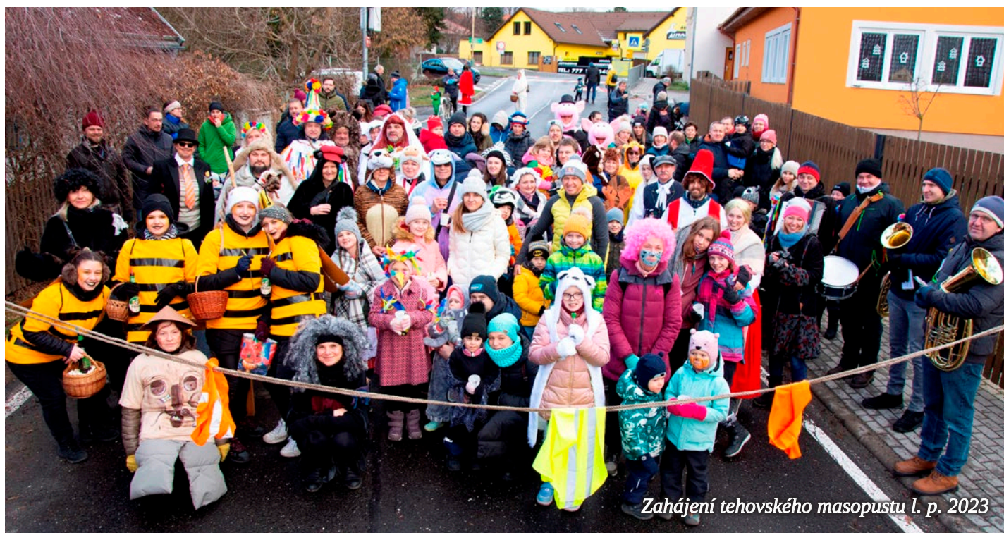
Zahájení tehovského masopustu 1. p. 2023