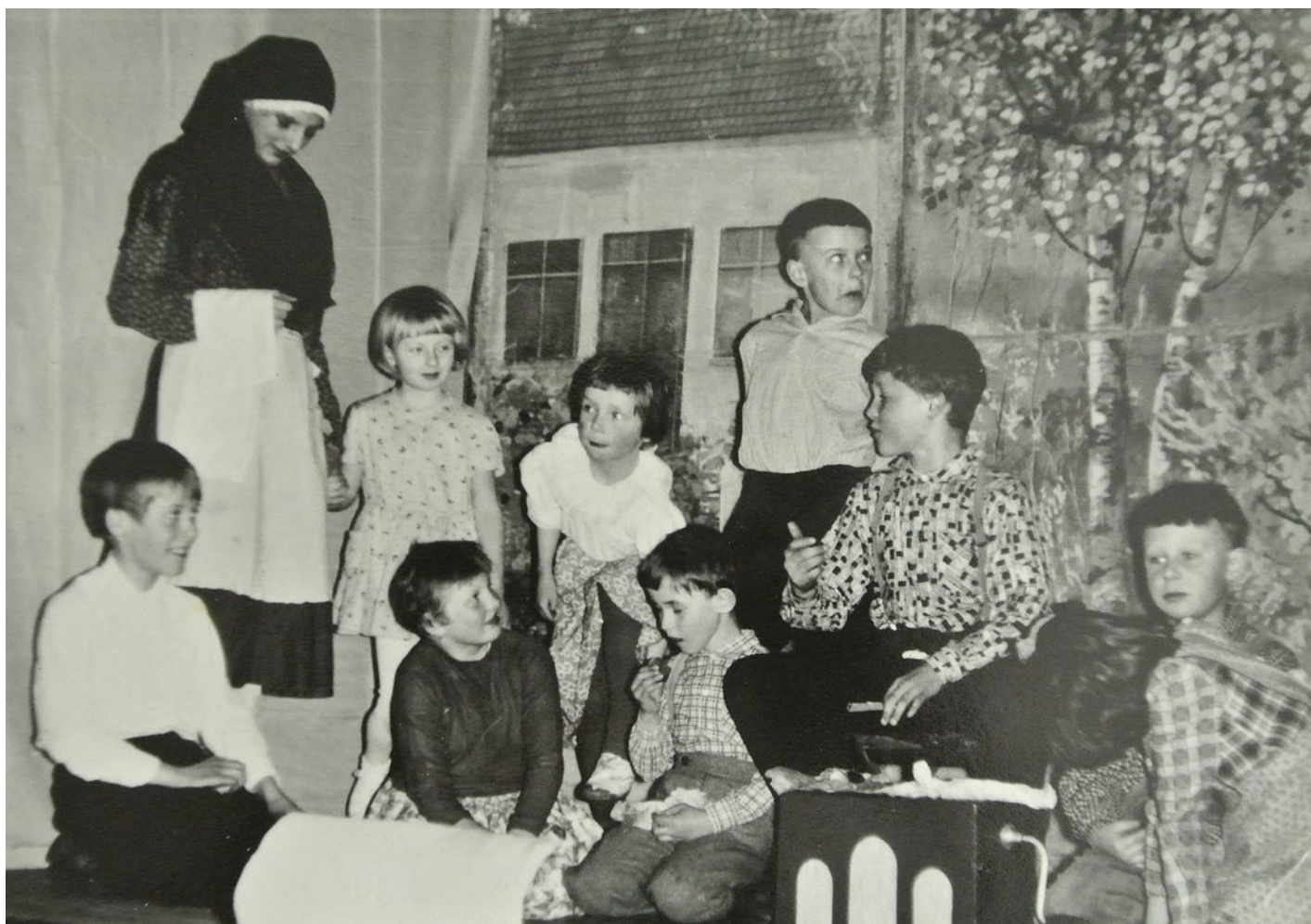
Divadelní představení Babička v podání tehovských herců, pravděpodobně 1968